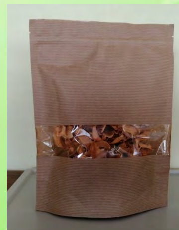
Овощные и фруктовые снеки в ассортименте