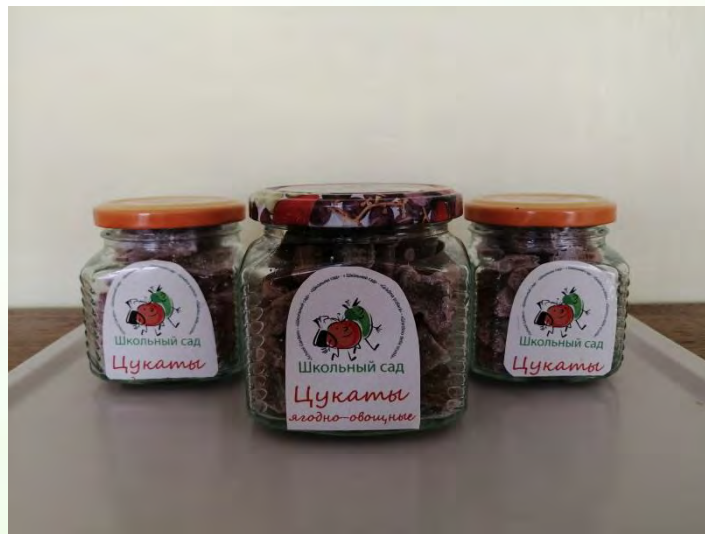
Цукаты в ассортименте