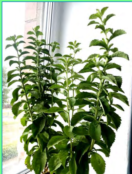
1. ИСХОДНОЕ РАСТЕНИЕ ДЛЯ ЧЕРЕНКОВАНИЯ