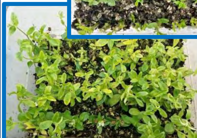
3. УКОРЕНЕНИЕ ЧЕРЕНКОВ В УСЛОВИЯХ ИСКУССТВЕННОГО ОСВЕЩЕНИЯ (УЧЕБНО- ИССЛЕДОВАТЕЛЬСКАЯ ЛАБОРАТОРИЯ)