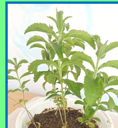
4. ГОРШЕЧНЫЕ РАСТЕНИЯ ДЛЯ ДАЛЬНЕЙШЕГО ЧЕРЕНКОВАНИЯ ИЛИ ВЫСАДКИ В ОТКРЫТЫЙ ГРУНТ