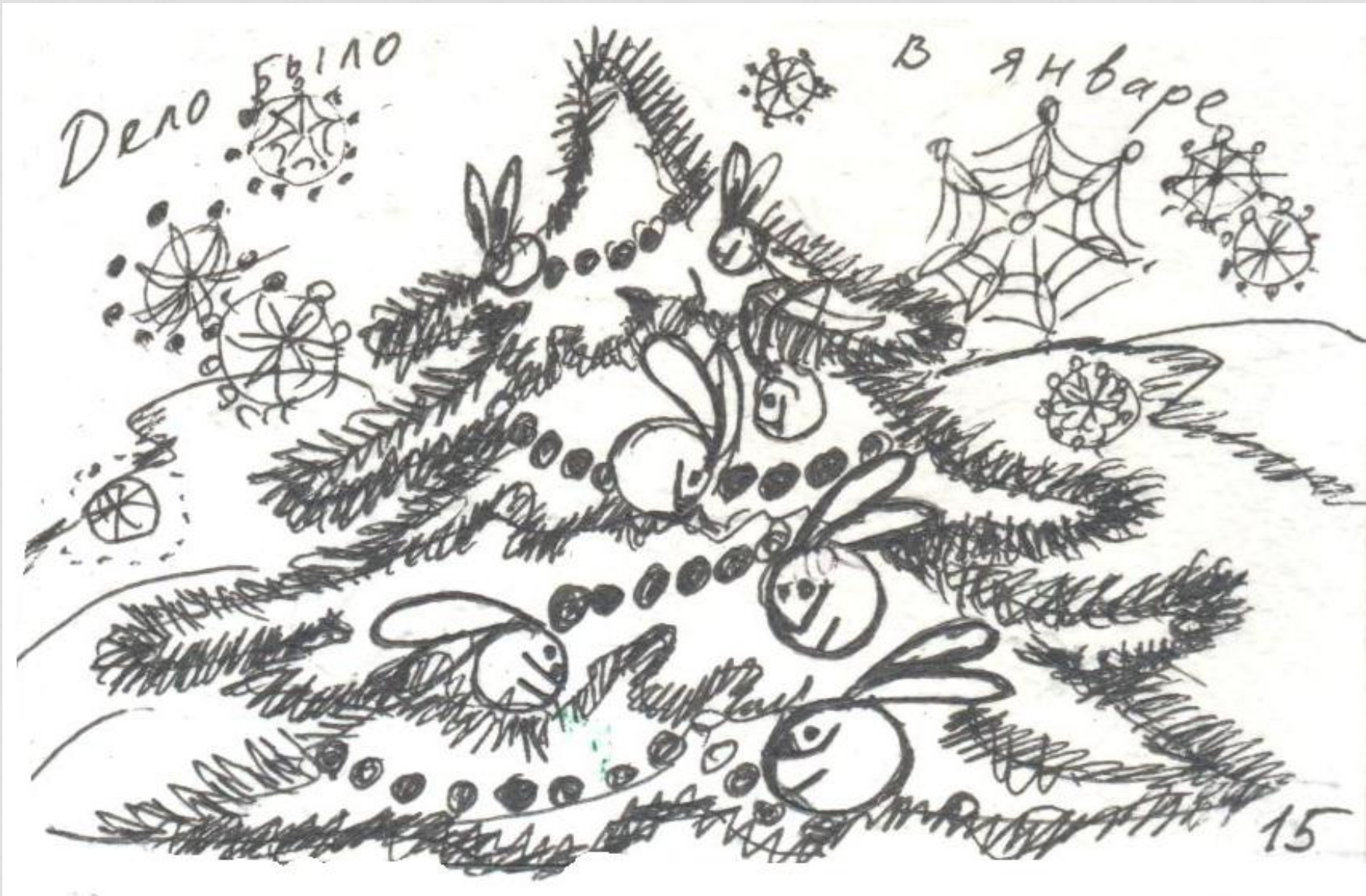
Дело было в январе...